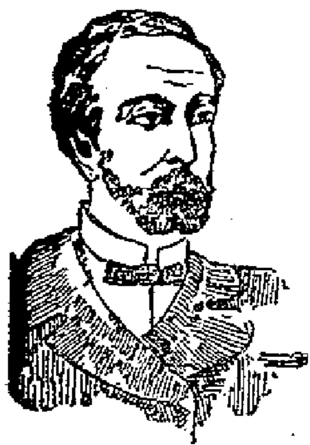
PRIMA DELLA CURA

AGUA de QUINA La mejor de las aguas para el cabello Recomendamos su pureza y fragancia