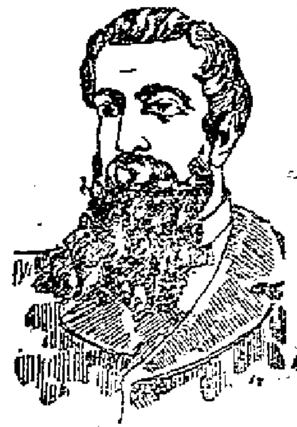
DOPO LA CURA